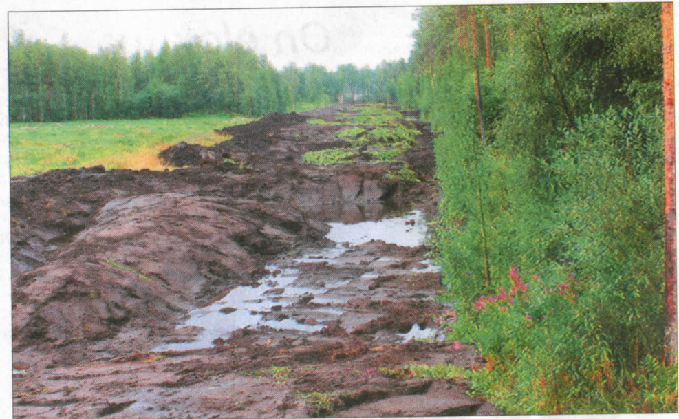
Ähtärin Turvepellon kosteikko on kooltaan 0,91 hehtaaria ja se sijaitsee Itä-Ähtärissä.

Jätteiden heitto veteen tai ojaan on kielletty, sillä vesistö ei pysty käsittelemään jätteitä. Myös loma-asunnon pesuvesien ei pidä päätyä järveen.